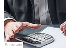
Como investir em imóveis com apenas 5 mil Reais (Empiricus Research)