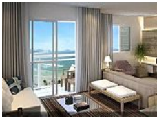
Mulher de Lula buscou pessoalmente as chaves do triplex no Guarujá