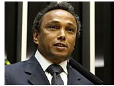
O deboche petista ao cerco na Venezuela