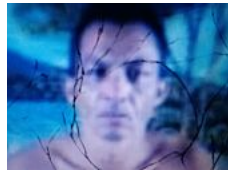
Barbárie no Piauí: meninas são estupradas e mutiladas