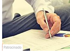
Fique Rico com Dividendos (Empiricus)