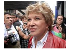
Marta é condenada e tem direitos políticos suspensos