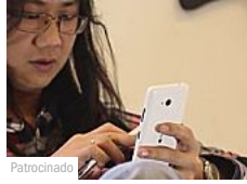
Microsoft Lumia 640 & Lumia 640 XL