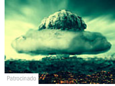
Uma grande Crise que ainda desconhecemos (Empiricus)